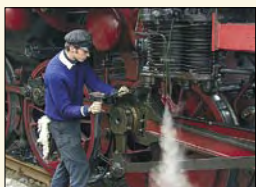
Wartung der historischen Fahrzeuge durch fachkundige Mitglieder

1969 machten sich in Ulm/Donau einige Eisenbahnfreunde Gedanken über die Erhaltung von historisch wertvollem Eisenbahnmaterial. 1971 kam es dann zur Gründung des Vereins der Ulmer Eisenbahnfreunde e.V. Die bundesweit über 600 Mitglieder betreuen heute 12 Dampflokomotiven, einige andere Triebfahrzeuge und mehrere Dutzend Wagen. Viele wurden in mühevoller Arbeit restauriert und repräsentieren heute einen breiten Querschnitt historischer Eisenbahnfahrzeuge. Die meisten Fahrzeuge sind betriebsfähig und werden bei regelmäßigen historischen Dampfzugfahrten von Ettlingen Stadt nach Bad Herrenalb, von Amstetten nach Gerstetten oder Oppingen und bei Sonderfahrten in fast ganz Europa eingesetzt.