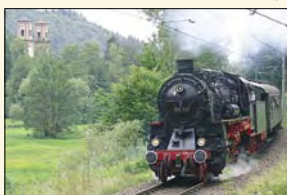
Im lieblichen Albtal. Links die markanten Türme der Klostersruine von Frauenalb.

In Ettlingen - mit seiner vorbildlich sanierten Altstadt und einer Reihe interessanter Baudenkmäler - beginnt unsere Dampfzugfahrt mit einem Zug