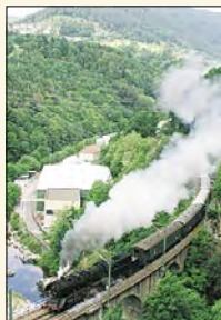
Der Dampfzug fährt über den Tennetschluchtviadukt

Nach der Übernahme der Murgtalstrecke durch die AVG fahren dort wieder regelmäßig historische Dampfzüge. Die Fahrt beginnt am Karlsruher Hauptbahnhof . In Rastatt verlassen wir das Rheintal entlang der Murg in Richtung Osten und kommen über Kuppenheim und Bad Rotenfels nach Gaggenau und später nach Gernsbach . Weiter fährt der Dampfzug bei Obertsrot am hoch über dem Murgtal thronenden Schloss Eberstein vorbei in das immer enger werdende Tal und erreicht Hilpertsau . Ab Weisenbach wird der Gebirgsbahncharakter durch zahlreiche Brücken und Tunnels unterstrichen. Besonders sehenswert ist der Tennetschluchtviadukt kurz hinter Langenbrand-Bermersbach , eine der wenigen erhaltenen originalen Steinbrücken. Nach Passieren von Forbach mit seiner charakteristischen Kirche, Raumünzach und Schönmünzach weitet sich das Tal hinter Schwarzenberg und bald wird über Klosterreichenbach der Kurort Baiersbronn , das Ende unserer Dampfzugfahrt, erreicht. Von hier kann man eine der zahlreichen Wandermöglichkeiten nutzen oder mit der Stadtbahn die wenigen Kilometer über die Steilstrecke nach Freudenstadt fahren. Auch im Murgtal gibt es einen gut ausgebauten Radweg, meist parallel zur Bahn, nach Rastatt .